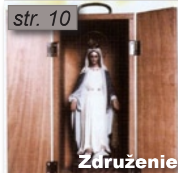
Združenie Zázračnej medaily