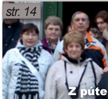
Z púte do Ríma