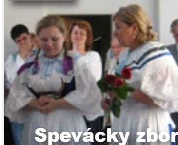
Spevácky zbor z Teplickej